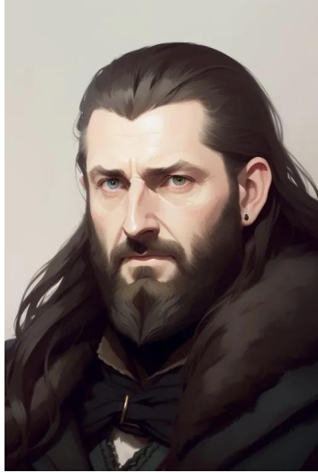
تورین سپر بلوط (سریال ارباب حلقه‌ها)