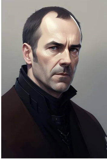
استنیس براتیون (سریال بازی تاجوتخت)