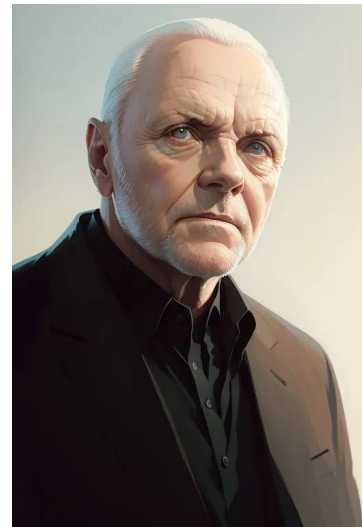
آنتونی هاپکینز (بازیگر)