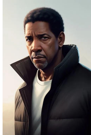
دنزل واشینگتن (بازیگر کارگردان)