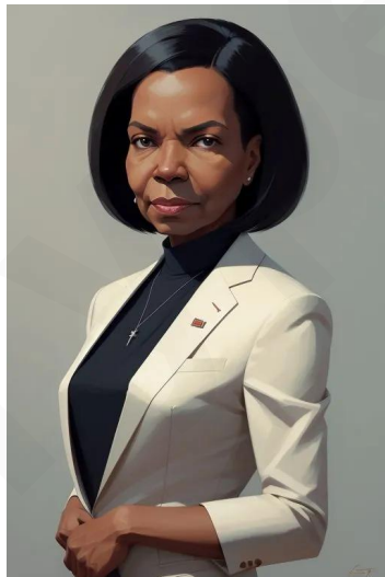
کاندولیزا رایس (سیاستمدار)