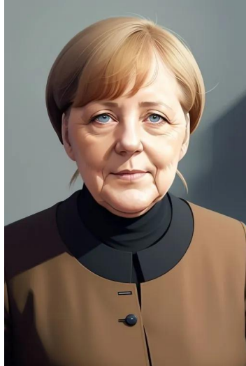
آنگلا مرکل (سیاستمدار)