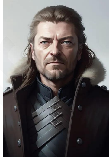
ادارد استارک (سریال بازی تاجوتخت)