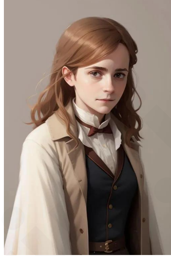
هرماینی گرنجر (سریال هری پاتر)