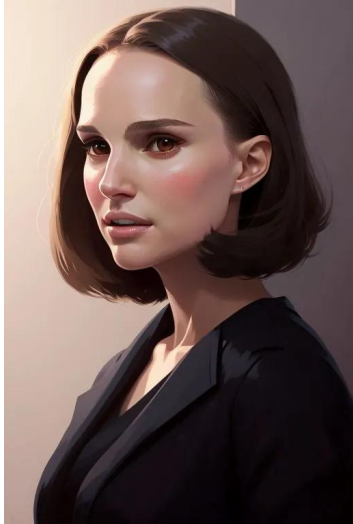
ناتالی پورتمن (بازیگر)