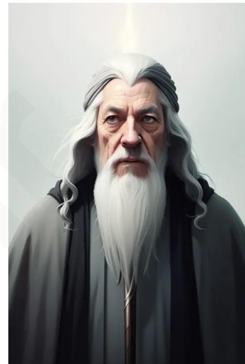
گندالف (سریال ارباب حلقهها)