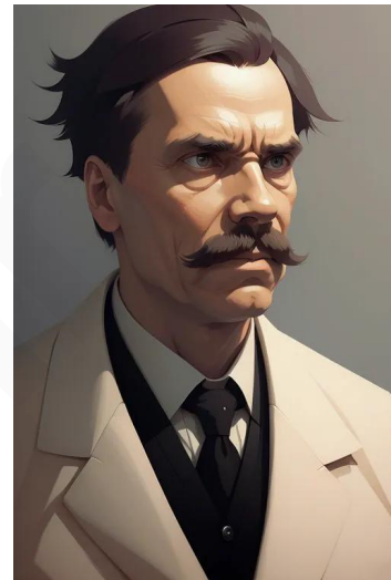
فریدریچ نیچه (فیلسوف)