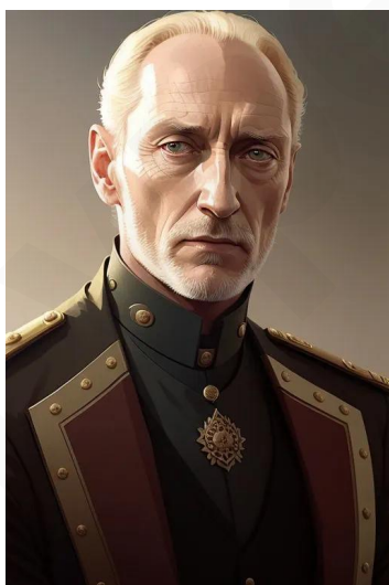
تایوین لنیستر (سریال بازی تاجوتخت)