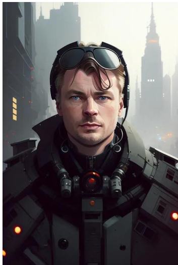
کریستوفر نولان (فیلمساز)