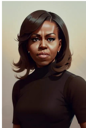
میشل اوباما (وکیل و نویسنده)