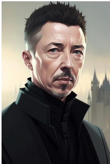
پیتر بیلش - انگشت کوچک (سریال بازی تاجوتخت)