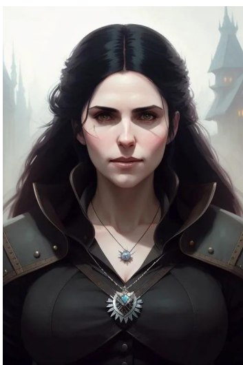
ینفر از ونگربرگ (سریال ویچر)