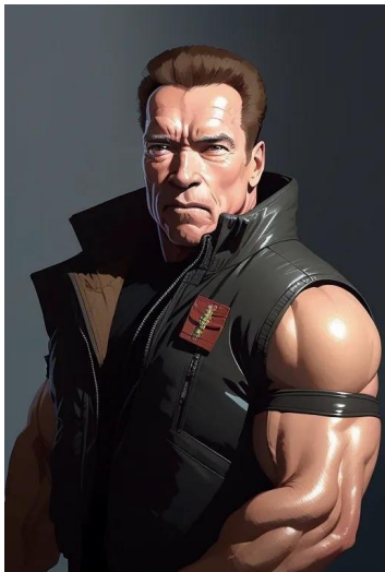
آرنولد شوارتزنگر (بازیگر)