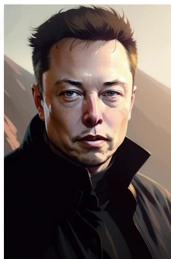
ایلان ماسک (سرمایه‌گذار)