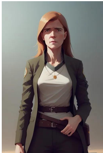
سامانتا پاور (سیاستمدار آمریکایی)