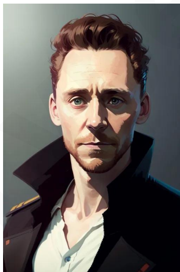
تام هیدلستون (بازیگر)