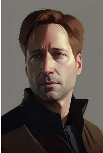
فاکس مولدر (سریال پرونده‌های ایکس)