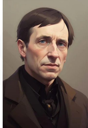
ویلیام وردزورث (شاعر)