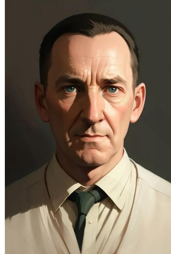
جی تالکین (شاعر مؤلف ارباب حلقه‌ها)