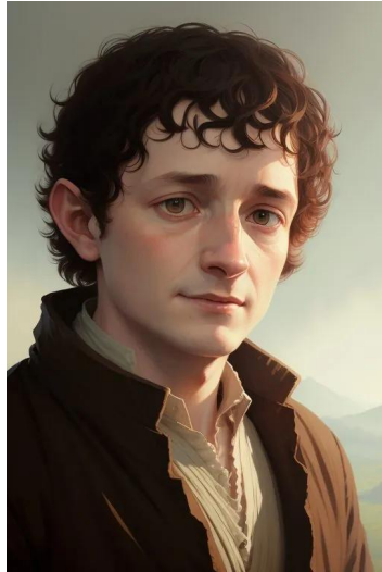
فرودو بگینز (سریال ارباب حلقه‌ها)