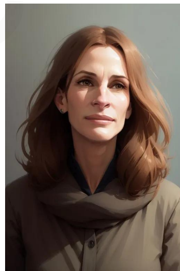
جولیا رابرتس (بازیگر)