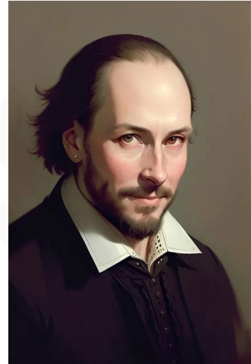
ویلیام شکسپیر (شاعر نمایشنامه‌نویس)