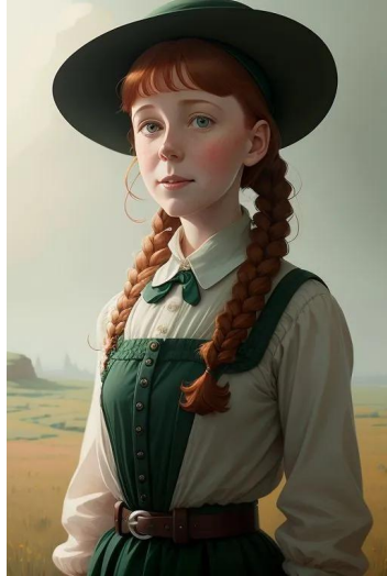
آن شرلی (آن شرلی با موهای قرمز)