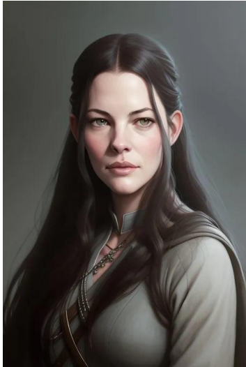
آرون (سریال ارباب حلقه‌ها)