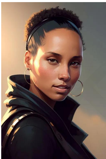
آی‌شیا کیز (خواننده)