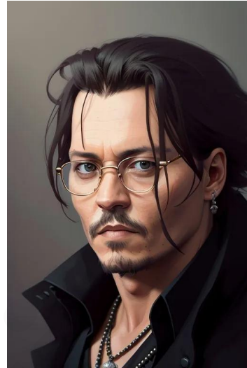
جانی دپ (بازیگر)