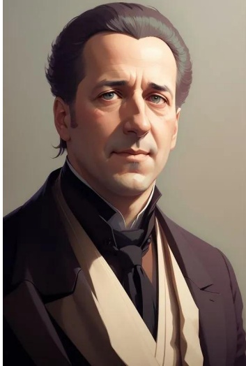
یوهان گوته (شاعر فیلسوف)