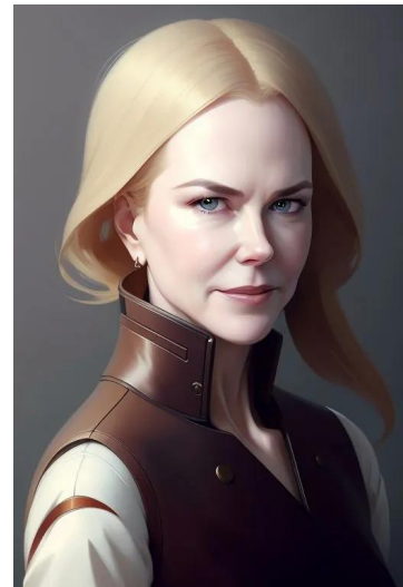
نیکول کیدمن (بازیگر تهیه کننده)