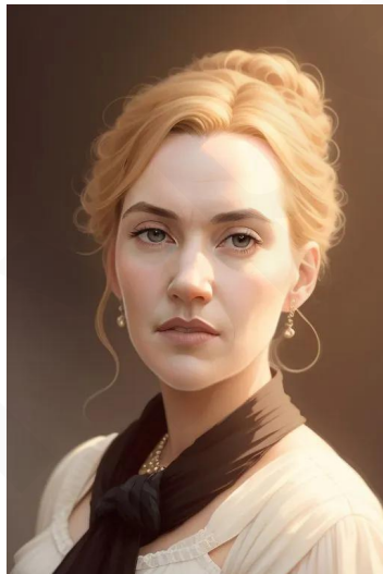
رز بوکاتر (فیلم تایتانیک)