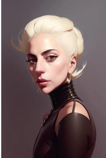
لیدی گاگا (خواننده بازیگر)