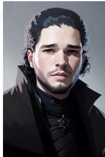
جان اسنو (سریال بازی تاج و تخت)