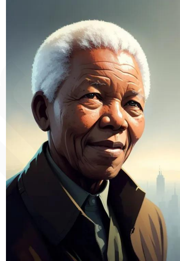
نلسون ماندلا (نخستین رئیس جمهور آفریقای جنوبی)