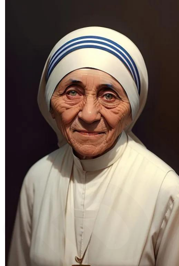
مادر ترزا (راهبه کاتولیک)