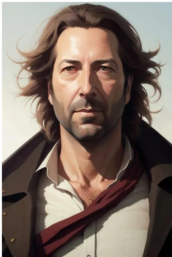
دزموند هیوم (سریال لاست)