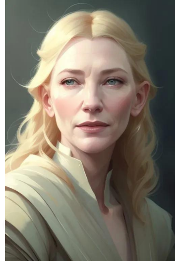
گالادریل (سریال ارباب حلقه‌ها)