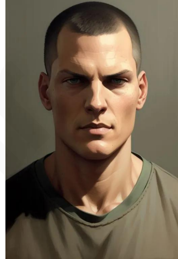
مایکل اسکافیلد (سریال فرار از زندان)