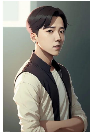
جی-هوپ (جونگ هو-سوک) (ترانه‌سرا بی‌تی‌اس)