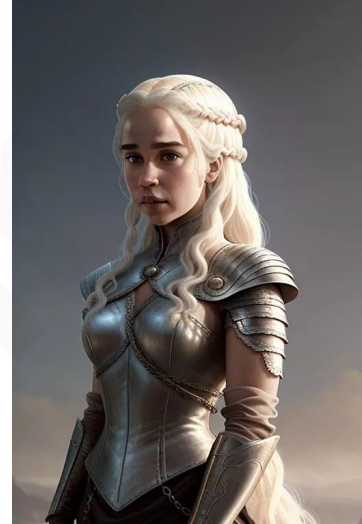
دنریس تارگرین (سریال بازی تاجوتخت)