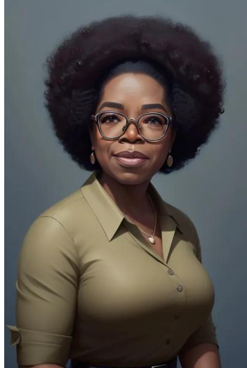
اپرا وینفری (تهیه‌کننده هنرپیشه)