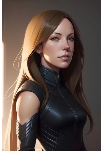
لارل لنس (سریال ارو)