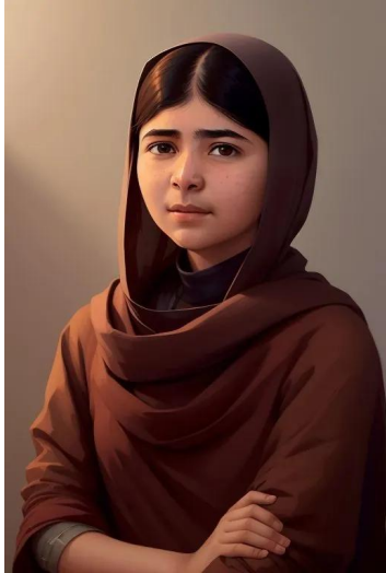
ملاله یوسفزی (فعال حقوق بشر)