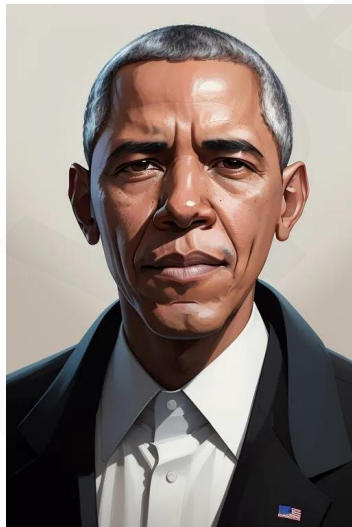
باراک اوباما (سیاستمدار آمریکایی)