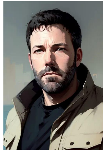
بن افلک (بازیگر و فیلم‌ساز)