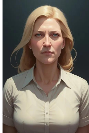
اسکایلر وایت (سریال بریکنگ بد)