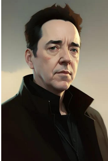
جان کیوسک (بازیگر)