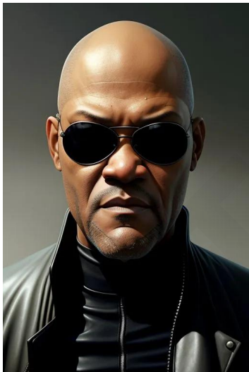
مورفئوس (فیلم‌های ماتریکس)