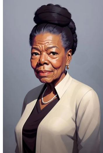
مایا آنجلو (شاعر خواننده)